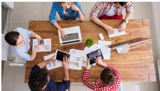
Tabela Referencial 2024: reta final.

Diretores do SINAPRO/Goiás participaram, no último dia XX/XX, de almoço no Antonieta Restaurante. Evento que marcou a apresentação institucional da parceria do Grupo Jaime Câmara, e da ESPM. Voltada para a realização de cursos da área, promovidos pela renomada instituição, para o mercado de Goiás e Tocantins. A presença da ESPM em Goiânia possibilita aos profissionais locais de desfrutarem da possibilidade de cursar aqui, de forma presencial ou híbrida, o que antes só poderia ocorrer nas outras unidades da Escola, em São Paulo, Rio de Janeiro e Porto Alegre.